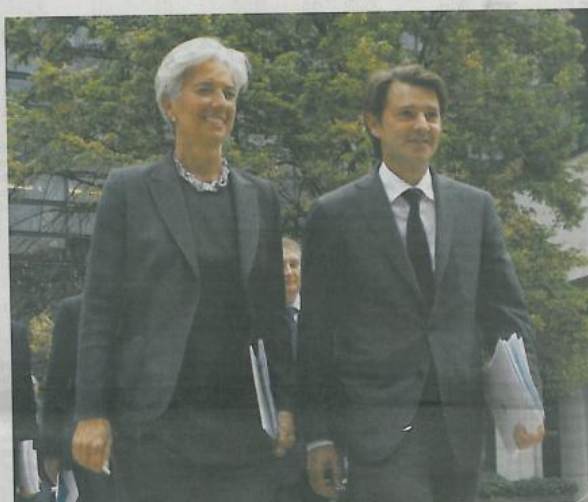
LE DÉFICIT DE LA FRANCE