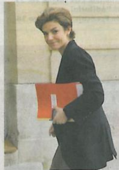
Chantal Jouanno, secrétaire d'Etat à l'Ecologie.

Ce document d'une cinquantaine de pages affirme que les parties prenantes doivent être impliquées dans le processus de décision et propose un schéma permettant de faire la différence entre un régime de prévention si le risque est avéré scientifiquement (volcan islandais, vaccin H1N1) et un régime de précaution